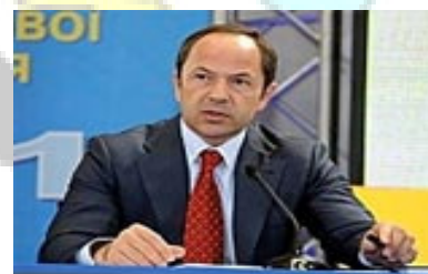
Αναπληρωτής Πρωθυπουργός και Υπουργός Κοινωνικής Πολιτικής Σεργίι Τιγκίτσκο

Η Ουκρανία χρειάζεται νέες πρωτοβουλίες για την στήριξη του τραπεζικού κλάδου δήλωσε ο Αναπληρωτής Πρωθυπουργός και Υπουργός Κοινωνικής Πολιτικής κ. Σεργίι Τιγκίτσκο κατά την διάρκεια επίσκεψης του στην Ουάσινγκτον για τις ετήσιες εργασίες του Διεθνούς Νομισματικού Ταμείου και της Παγκόσμιας Τράπεζας.