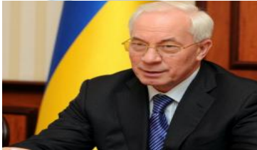
Ο Πρωθυπουργός κ. Μ. Αζάρωφ

«Το ΑΕΠ της Ουκρανίας την περίοδο Ιανουαρίου-Οκτωβρίου 2011 παρουσίασε αύξηση κατά 5,3% έναντι της ίδιας περιόδου του 2010, ενώ η βιομηχανική παραγωγή αυξήθηκε κατά 9%». Αυτά δήλωσε ο Ουκρανός Πρωθυπουργός κ. Μ. Αζάρωφ, για να προσθέσει ακολούθως: «Ο πληθωρισμός για τον τρίτο συνεχόμενο μήνα εμφανίζει μικρή μείωση, αν και παρατηρήθηκε αύξηση των μισθών και των συντάξεων».