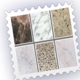
ΜΑΡΜΑΡΑ – ΓΡΑΝΙΤΕΣ