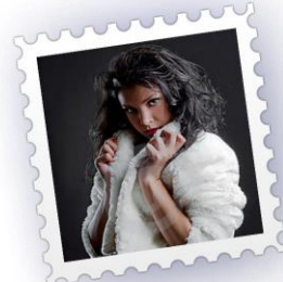
ΓΟΥΝΕΣ – ΔΕΡΜΑΤΑ