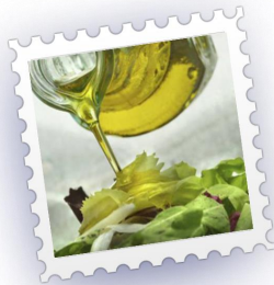
ΤΡΟΦΙΜΑ – ΠΟΤΑ

Δημιουργήσαμε ξεχωριστές κατηγορίες προϊόντων με αντίστοιχες υποκατηγορίες για εύκολη και δυναμική αναζήτηση και πρωτοποριακές δυνατότητες προβολής!