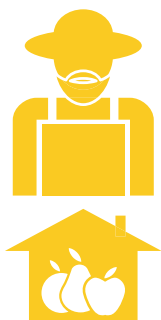
2. Παραδοσιακοί βιοπαλαιστές