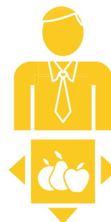
5. Πολυλειτουργικοί επιχειρηματίες

Ο πιο αντιπροσωπευτικοί τύποι μΓΕ στις ΠΑ της Νότιας Ευρώπη