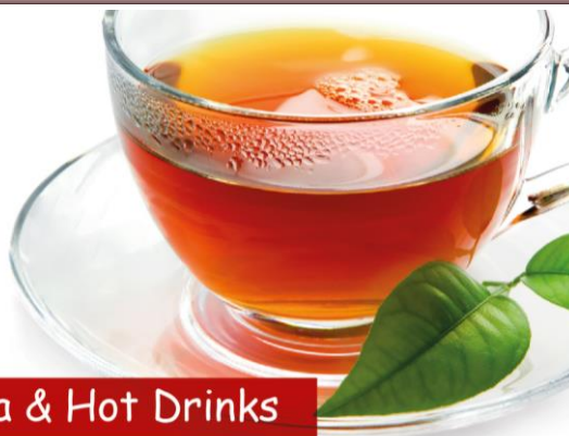
Tea & Hot Drinks