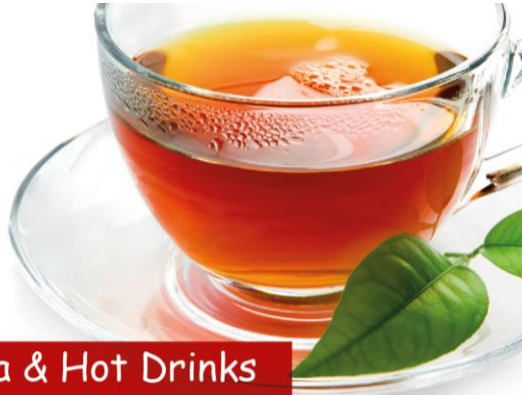
Tea & Hot Drinks