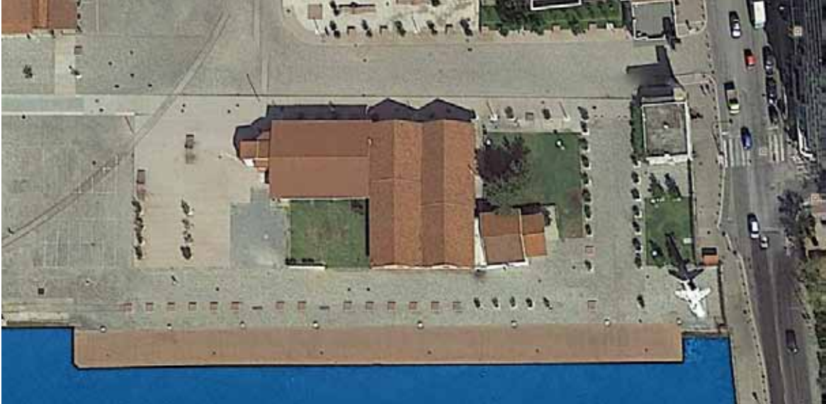
Φωτογραφία - κάτοψη του χώρου διεξαγωγής της έκθεσης.

Σε αυτόν εξαιρετικά όμορφο και πολυσύχναστο χώρο θα αναδείξουμε την ποιότητα και την υπεροχή των κρητικών προϊόντων.